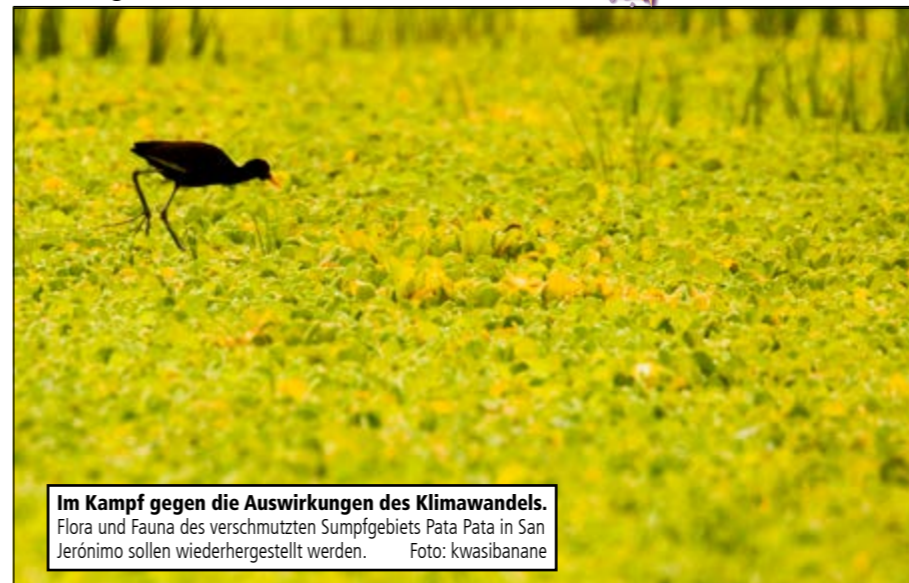
Im Kampf gegen die Auswirkungen des Klimawandels. Flora und Fauna des verschmutzten Sumpfgebiets Pata Pata in San Jerónimo sollen wiederhergestellt werden.