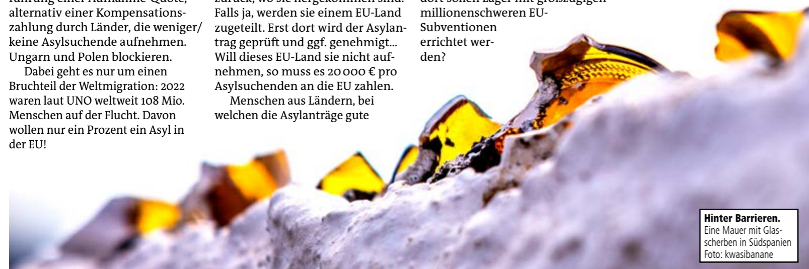
Hinter Barrieren. Eine Mauer mit Glas-scherben in Südspeanien

Zum Glück kann der Beschluss des Innenministerrats ohne Zustimmung des EU-Parlaments nicht in Kraft treten. Die dortige Debatte wird spannend, denn die Regierungschefs von Ungarn und Polen haben am 29. Juni beim EU-Gipfel schon bekundet, dass sie weder Asylsuchende aufnehmen noch Geldstrafen bezahlen wollen. Andere EU-Abgeordnete werden aus Menschenrechtsgründen dem Kompromiss nicht zustimmen. Wer aus seinem Heimatland flieht und sich in (Lebens-)Gefahr bringt, hat viel Leid erfahren, sonst würde er sich nicht auf den Weg machen. Menschenrechte gelten für alle Menschen!