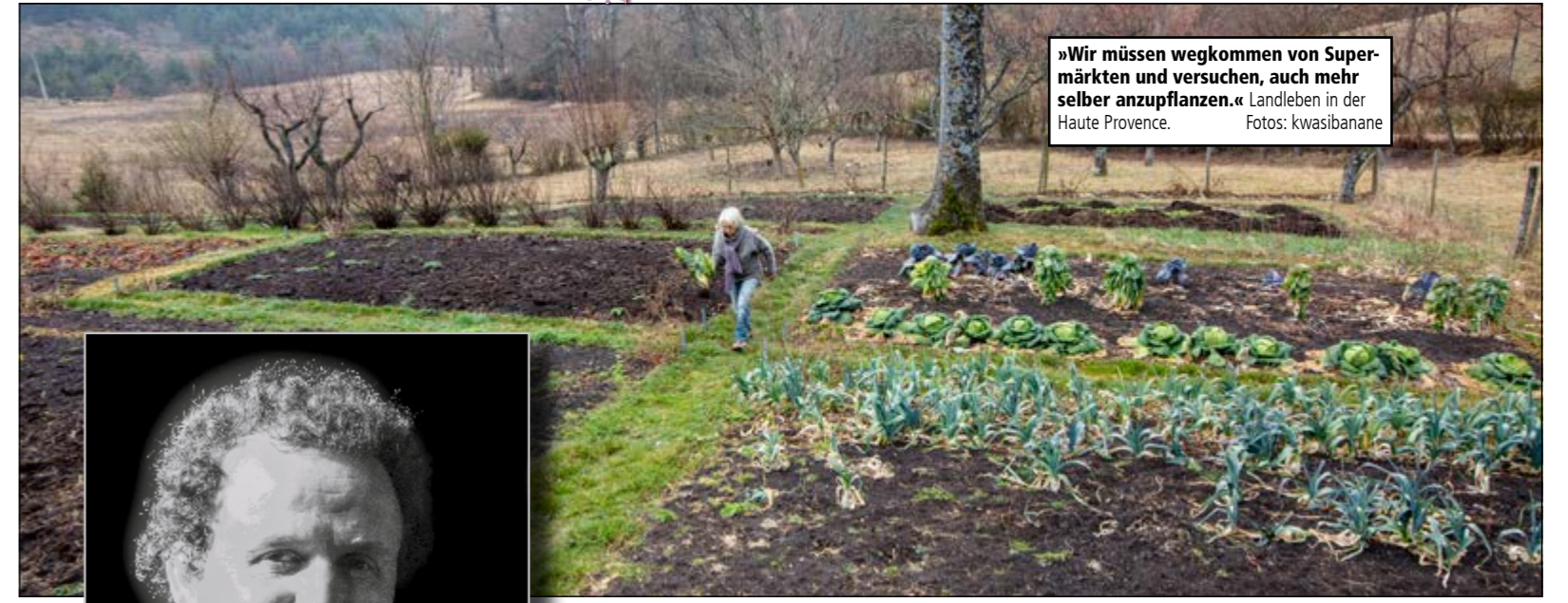
»Wir müssen wegkommen von Supermärkten und versuchen, auch mehr selber anzupflanzen.« Landleben in der Haute Provence.

Unser OB bedankte sich für die Geste. Er wies darauf hin, dass er kein Freund von Stereotypen, egal, welchen Gruppierungen diese zugeschrieben werden, sei. Er wisse zu schätzen, dass Migrant_innen sich ebenso für Umwelt- und Klimaschutz einsetzen.