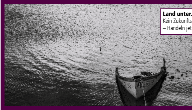
Land unter. Kein Zukunftsthema – Handeln jetzt!

Binnenvertreibung (IDMC) schätzt, dass im Jahr 2021 von insgesamt ca. 38 Millionen intern Vertriebenen 22,3 Millionen auf Extremwetterereignisse zurückzuführen sind. Bei Ländern des globalen Nordens können Umweltveränderungen durch hohe Kapazitäten und Ressourcen abgefangen werden, sodass diese Menschen nicht den Bedarf haben zu migrieren. Dabei sind es die Länder des globalen Nordens, die historisch gesehen für den größten Anteil der Treibhausgasausstöße verantwortlich sind. Es wäre nur fair, wenn sie den Ländern des globalen Südens eine Stütze wären und helfen würden, die Folgen der Klimakatastrophe abzufedern. Ein erster Schritt wäre, Klimaflüchtlinge als solche anzuerkennen.