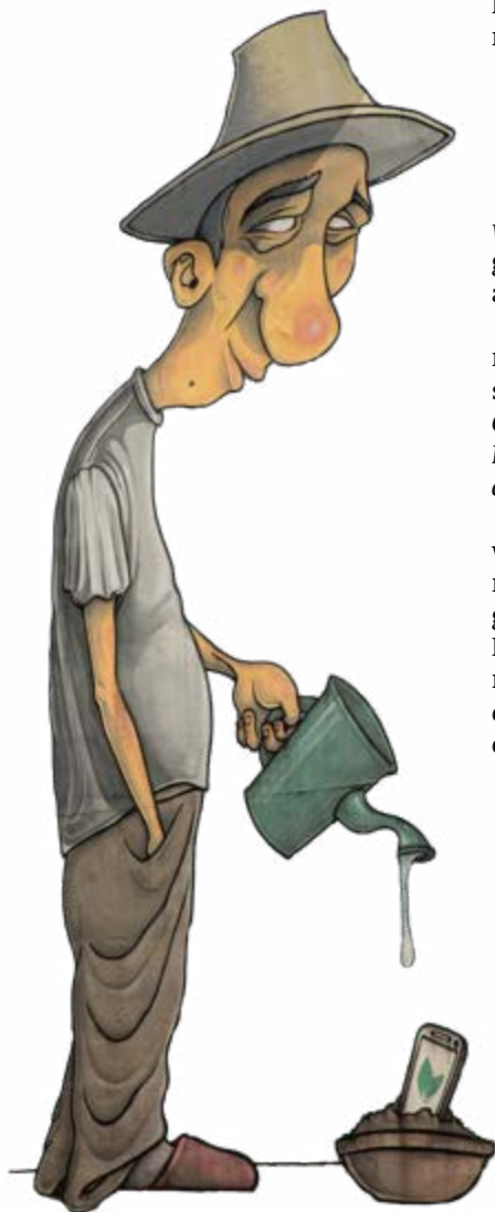
◀ Aufforstung? Street art an einer Schule im rumänischen Sibiu