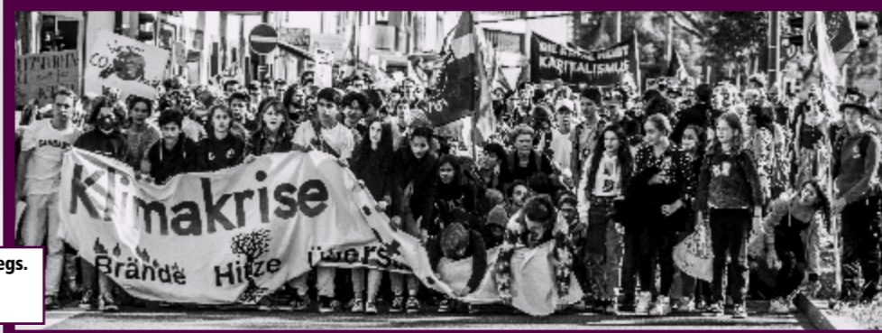
Die Zukunft unterwegs. Fridays for Future, Freiburg, September 22

Binnenvertreibung (IDMC) schätzt, dass im Jahr 2021 von insgesamt ca. 38 Millionen intern Vertriebenen 22,3 Millionen auf Extremwetterereignisse zurückzuführen sind. Bei Ländern des globalen Nordens können Umweltveränderungen durch hohe Kapazitäten und Ressourcen abgefangen werden, sodass diese Menschen nicht den Bedarf haben zu migrieren. Dabei sind es die Länder des globalen Nordens, die historisch gesehen für den größten Anteil der Treibhausgasausstöße verantwortlich sind. Es wäre nur fair, wenn sie den Ländern des globalen Südens eine Stütze wären und helfen würden, die Folgen der Klimakatastrophe abzufedern. Ein erster Schritt wäre, Klimaflüchtlinge als solche anzuerkennen.