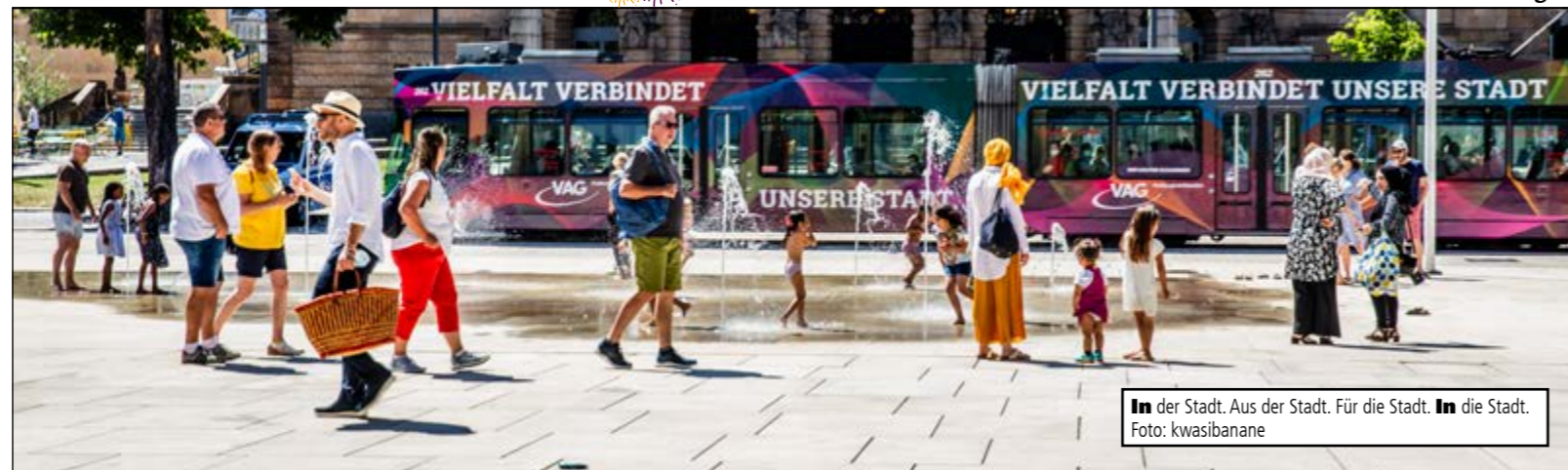
In der Stadt. Aus der Stadt. Für die Stadt. In die Stadt.