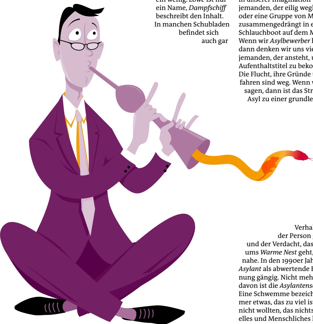
▲ Der Schlangenschwörungserzähler

irgendwie kennen oder zu kennen meinen. Auf die Schubladen kleben wir Zettel mit Worten. Dort wo die Kartoffeln sind, kleben wir den Zettel Kartoffel , dort wo die Gespenster sind, steht eben Gespenst drauf. Die Zettel benennen die Dinge in den Schubladen und manchmal, beschreiben sie sie auch ein wenig. Löwe ist nur ein Name, Dampfschiff beschreibt den Inhalt. In manchen Schubladen befindet sich auch gar