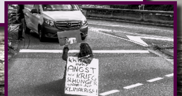
Ein Denkmal von morgen? Straßenblockade in Freiburg, März 21

Wenn es derzeit wirklich Rebellen gibt, dann ist das die Letzte Generation und die spüren ja auch wirklich Repression, nicht die Autobahnraser. Und wie bei Rebellen so üblich, baut man ihnen ein Denkmal vielleicht hundert Jahre später, wenn einige Schattenseiten längst vergessen sind und wir eingesehen haben, dass sie auf der richtigen Seite der Geschichte standen. Aber vielleicht merken wir das ja diesmal schon früher.